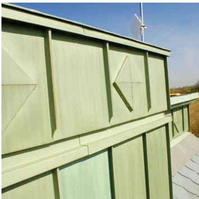
▲ Obróbka muru kryjącego kominy