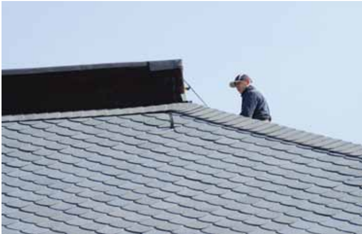
◀ „Skręcające” płytki na narożu

Wykonawca zastosował ciekawy zabieg, podnoszący walory estetyczne dachu. Polega on na „skręceniu” płytek w miejscu przechodzenia naroża w koronkę – czyli w ostatnim rzędzie kamieni na dachu. Jeśli chodzi o haki bezpieczeństwa, to montowano je w dwóch rzędach. Pierwszy rząd mniej więcej po środku połaci (2 haki skrajne montowane blisko naroży), a drugi wysoko, prawie pod samą attyką (3 haki – dwa przy narożach oraz jeden w osi połaci). Haki wykonano na zamówienie, dzięki czemu są one dodatkowo wzmocnione i tak jak wszystkie elementy