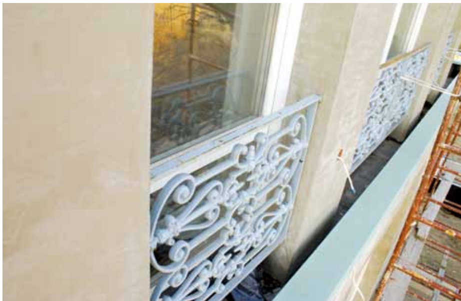
▲ Obróbka blacharska murku otaczającego dom

stopni i zamontowane również na podkładzie. Podczas wymiarowania uwzględniono rozszerzalność cieplną materiału, pozostawiając miejsce na pracę blachy, czyli jej kurczenie i rozszerzanie się. Jeśli zaś chodzi o wymiary samych obróbek, to zostały one dobrane tak, aby widoczne z zewnątrz elementy (pionowa widoczna część obróbki) nie skupiały na sobie uwagi, a delikatnie „ginęły” na tle elewacji. Całość wygląda bardzo estetycznie, nie widać bowiem łączeń krótkich odcinków blachy, co udało się uzyskać dzięki walcowaniu na zimno.