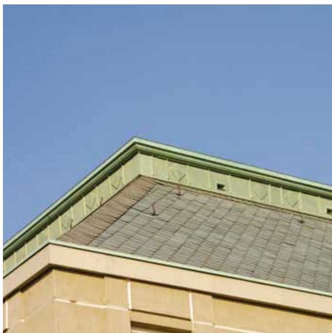
▲ Fragment gotowego dachu