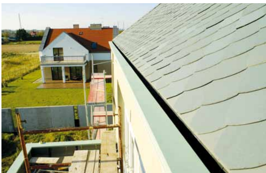
▲ Na dachu nie ma tradycyjnych rynien – jest zagłębione koryto na okapie

Format gotycki nie jest skomplikowanym typem krycia i samo układanie łupkowych płytek na dachu o powierzchni ok. 250 metrów trwało niecałe 4 tygodnie. Kamienie mocowano tradycyjnie przy użyciu miedzianych gwoździ. Naroża wykonano na tzw. nakładkę z łupka prostokątnego o formacie 300 × 200 mm; narożniki kamieni narożnych zaokrąglono, dzięki czemu dach łagodnie przechodzi w linie kalenicy szczytowej. Dla zachowania szczelności każdy rząd w narożu zabezpieczono ołowianą podkładką.