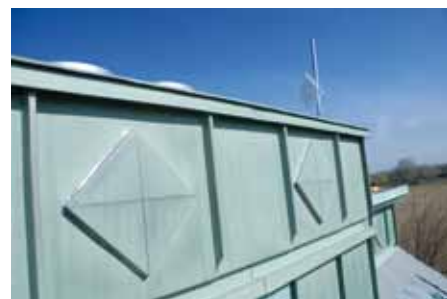
▲ Elementy niezbędne, ale nie dodające obiektowi uroku, zostały ukryte za attyką