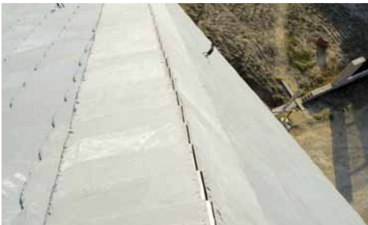
◀ Na narożach pod pokryciem znalazły się otwierane podkładki, tzw. noki