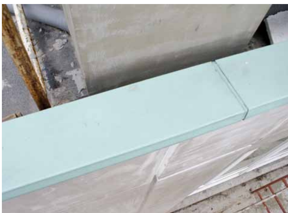
▲ Dylatacja w obróbce