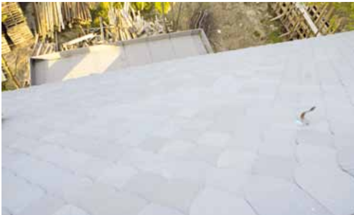
◀ Łupkowe kamienie mocuje się miedzianymi gwoździ