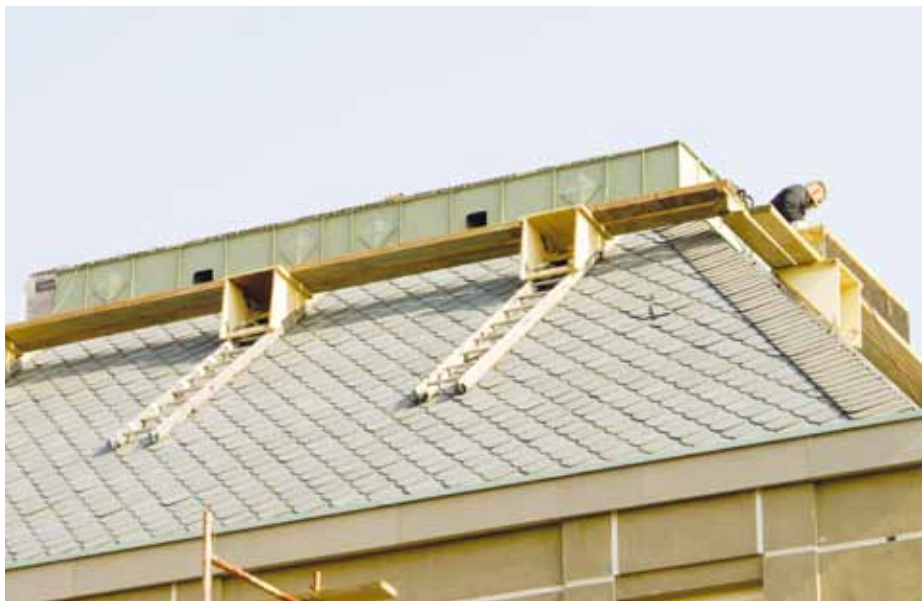
▲ Attykę obrabiano już po ułożeniu pokrycia, potrzebne były więc nietypowe pomosty robocze

projektu przez damską część inwestorów sporządziliśmy ostateczną wersję dokumentacji – wszystkie przekroje, podział i położenie poszczególnych rąbków i kasetonów. Trzeba tutaj dodać, że równy podział rąbków zaburzały przepusty odwadniające ukryte za attyką dach płaski.